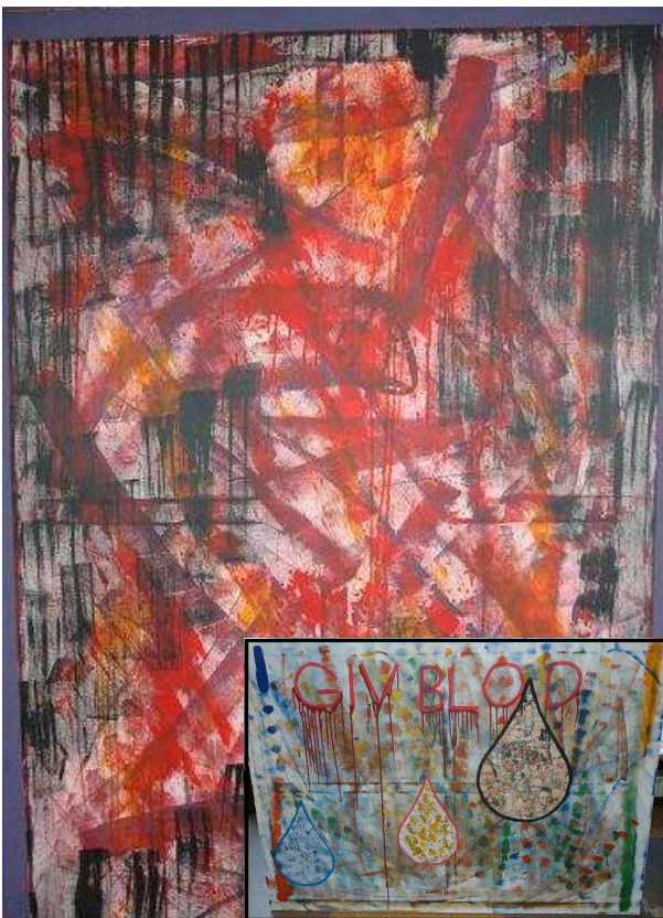
Her er to af de malerier interesserede kan få lov til at låne.