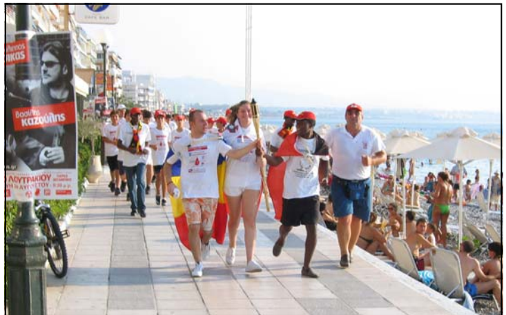
I 2007 blev Internationalt Ungdomsforum afholdt i Grækenland.

Internationalt Udvalg har sammen med Bloddonorerens Ungdomskomiteé (BU) nedsat en styringsgruppe, som aktivt vil engagere sig i planlægning og gennemførelse af arrangementet. Der forventes minimum 85 deltagere – fra Danmark skal findes 10 deltagere plus en lille håndfuld frivillige hjælpere. Den internationale ungdomskomiteé står for det faglige program.