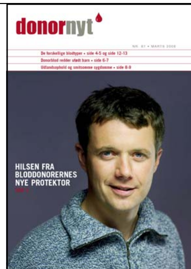
Næste nummer af Donor Nyt udkommer fra den 7. marts.