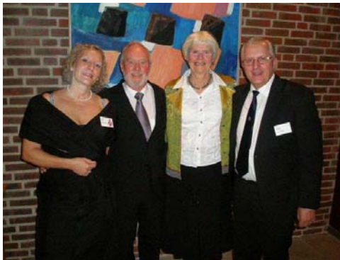
De sidste fire års vindere af titlen som "Årets Bloddonor" var samlet på landsmødet i Nyborg i oktober.

Offentliggørelsen af Årets Bloddonor 2008 finder sted på Den Internationale Bloddonor dag lørdag den 14. juni 2008. Begrundede indstillinger af kandidater sendes til mikkelsen@bloddonor.dk senest den 1. april 2008.