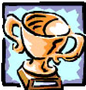
Førstepræmien ved Bloddonorernes plakatkonkurrence er 10.000 kr. værd!

I anledning af 75-års jubilæet for den første donortapning i Danmark har Bloddonorerne indledt en stor, landsdækkende plakatkonkurrence .