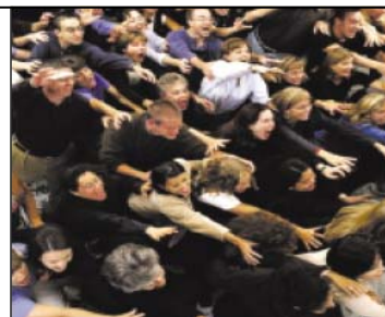
Samme uge som nyheden om det HIV-smittede donorblod modtog Bloddonorerne dobbelt så mange tilmeldinger som normalt.

Og ikke alene er der kommet flere bloddonorer. De nyilmeldte er også blevet mere bevidste om at informere om deres livsstil. Det skyldes blandt andet pressens dækning af sagen med det HIV-smittede blod.