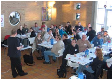
Det seneste informatørkursus blev afholdt i Slagelse. Se bagsiden.

Erfarne informatører inviteres til kursus i Fredericia lørdag den 4. marts.