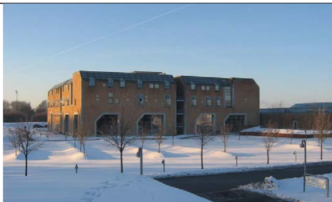
Slagelse Centralsygehus var vært for informatørkurset i januar. Kurset bød på både sne og sol!

Informatørnetværket rundede i januar 200 medlemmer.