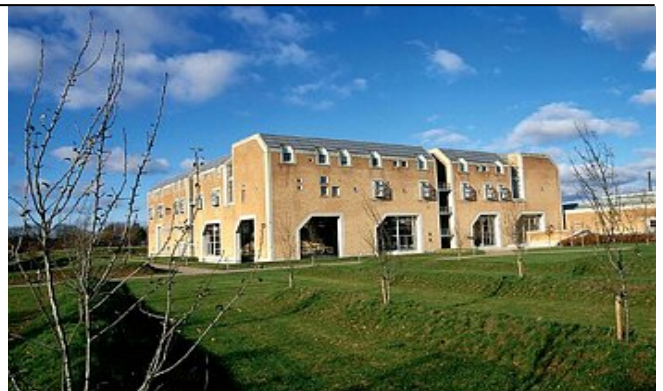
Slagelse Centralsygehus er vært for informatørkursus den 28. januar.

Der vil også blive tid til en rundvisning i blodbanken. Deltagelse er gratis og tilmelding skal ske til malou@bloddonor.dk