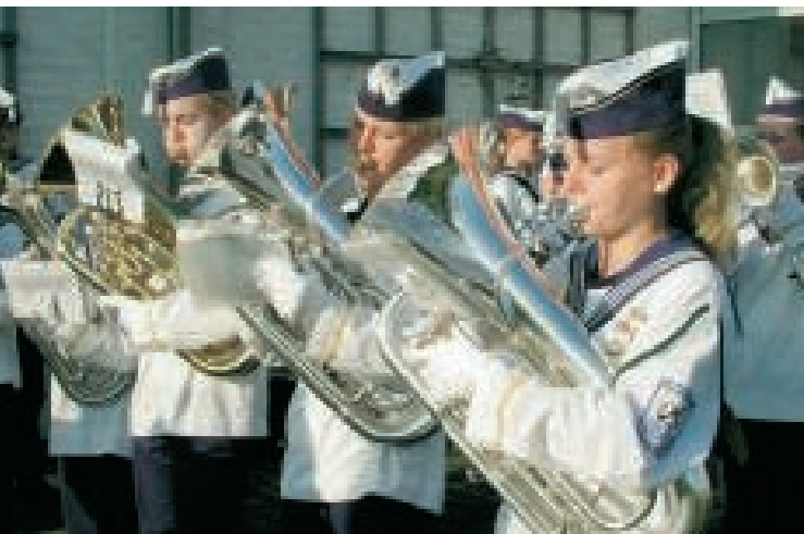
Skælskør Marinegarde tog imod.