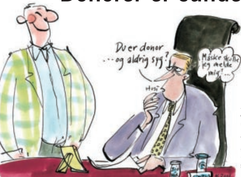
Illustration: Annette Carlsen