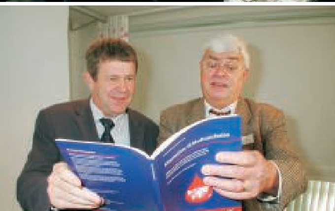
Ministeren og landsformanden deler lektüre.