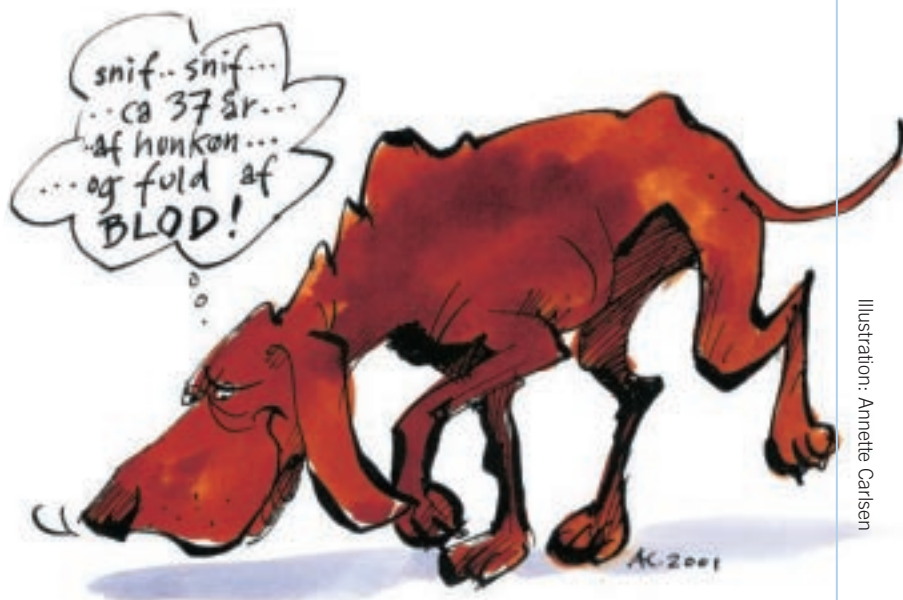
Illustration: Annette Carlsen

Producenterne bag systemet fortæller også, at systemet til enhver tid kan give et overblik over, hvordan beholdningen af de enkelte blodtyper ser ud. Samtidig repræsenterer Blodhund en radikal forbedring af katastrofeberedskabet, da systemet kan varsle 600 donorer i minuttet.